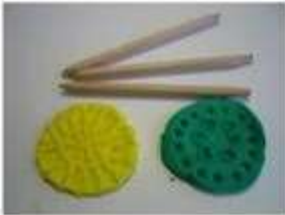
une galette décorée